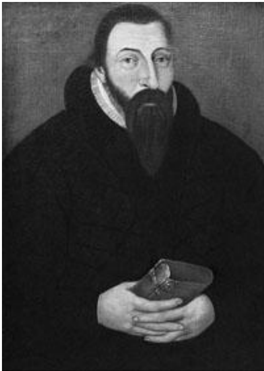
Biskop Jens Nilssøn av Oslo. Maleri fra Oslo domkirkes bispegalleri. Det er hevdet at bildet forestiller hans etterfølger Anders Bendssønn Dahl. Påstanden er omdiskutert, så vi går ut fra at det fremstiller Nilssøn.